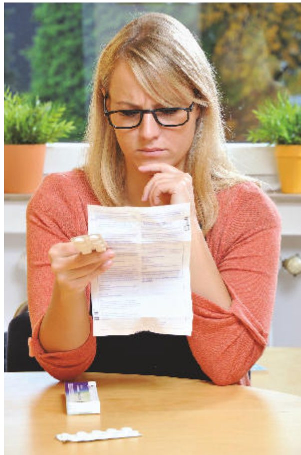
Sind bei diesem Medikament geschlechtsspezifische Unterschiede in der Wirkung zu erwarten? Oft schweigen sich selbst Fachinformationen über solche Fragen aus.