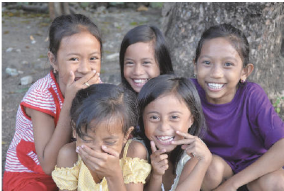
Mit Schulpatenschaften hat der Verein „Chance for growth“ besonders die Chancen von Kindern auf den Philippinen in den Blick genommen.

Ist man die Steintreppe am Anleger der Isla Verde erst einmal hinaufgestiegen, erzählt Kories, führt der Weg in kleine Dörfer. „Autoverkehr gibt es nicht, die Menschen leben von Landwirtschaft und Fischerei, einige pendeln mit dem Boot zur Arbeit aufs Festland.“ Viele Häuser auf der Isla Verde haben offene Feuerstellen. „Das ist besonders für Kinder