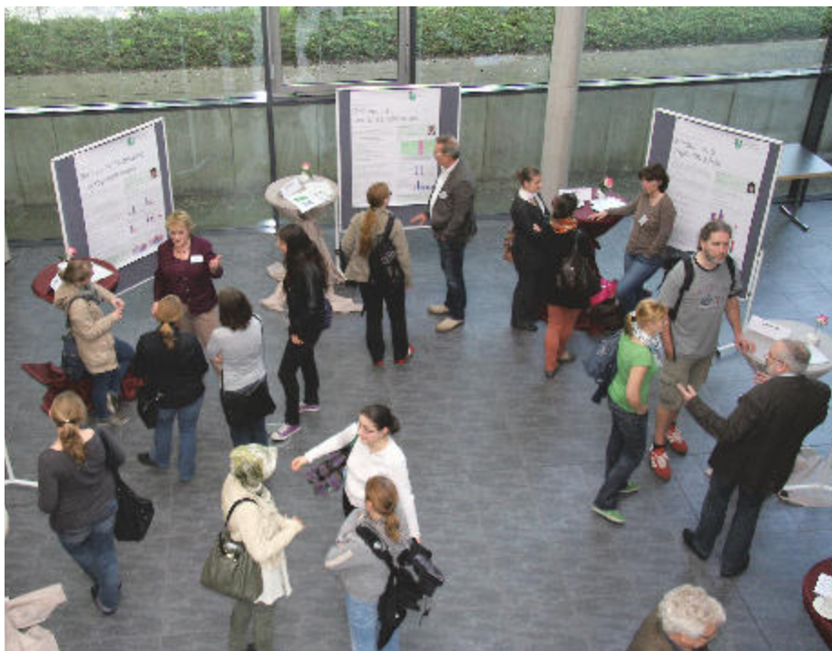
Im persönlichen Gespräch konnten die Teilnehmer beim Tag der Ärztekammer in Bochum Informationen zur Facharzt-Weiterbildung in vielen Gebieten erhalten.

Bei der individuellen Gestaltung der Berufsausübung sei bereits ein großes Maß Flexibilisierung erreicht, stellte Dr. Reinhardt heraus.