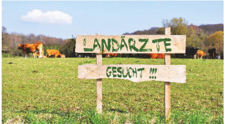
Landärzte gesucht: Den ländlichen Raum würde der sich abzeichnende Versorgungsnotstand zuerst mit voller Härte treffen – das ist nur ein Ergebnis der Umfrage des Hartmannbundes.

Der Wunsch nach flexiblen Arbeitszeitmodellen und planbaren Arbeitszeiten spielen bei der jungen Ärztegeneration eine wesentliche Rolle. Nicht ohne Grund: 83 Prozent der