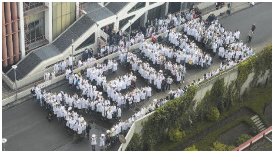
Zwang schafft keinen Hausärzte-Nachwuchs: Ein deutliches Zeichen gegen einen Zwangsabschnitt Allgemeinmedizin im Praktischen Jahr setzten die Studierenden der Medizinischen Fakultät der Westfälischen Wilhelms-Universität Münster. Die Aktion, organisiert durch die Fachschaft Medizin Münster, war nur ein Teil einer bundesweiten Welle von Protestaktionen im Vorfeld der Entscheidung des Bundesrates zur Novellierung der Ärztlichen Approbationsordnung.

Die Bundesvertretung der Medizinstudierenden in Deutschland e. V. (bvmd) begrüßte die Änderungen nachdrücklich. Die Splitting des Hammerexamens gebe den Studierenden die Möglichkeit, während des Praktischen Jahres einen stärkeren Fokus auf den Erwerb klinisch-praktischer Fähigkeiten zu legen. Die verlängerte Vorbereitungszeit für den schriftlichen Teil des Examens sei dabei essentiell, um den Prüfungserfolg nicht zu gefährden. Besonders